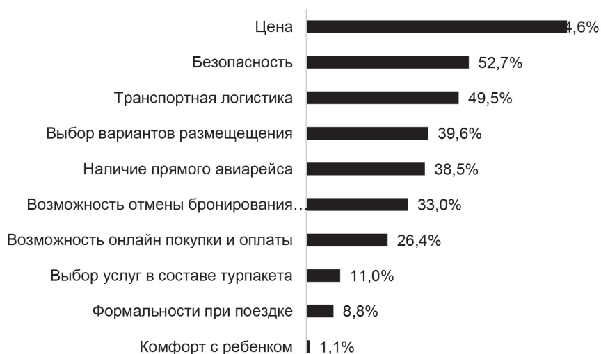
Рисунок 4. Риски путешествий за рубеж в 2022 г., множественный ответ, в процентах к числу опрошенных (составлено авторами)

КРІ реализации проекта, что позволяет оценивать промежуточные результаты и эффективность проекта, при необходимости вносить корректировки в зависимости от развития экосистемы туризма на различных уровнях. Некоторые результаты и показатели реализации Национального проекта «Туризм и индустрия гостеприимства» представлены ниже (табл. 6,7, составленные авторами на основе [1; 2]).