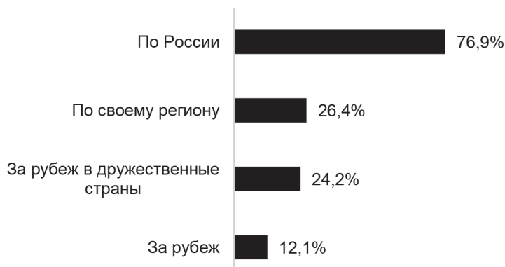
Рисунок 2. Планируемые направления путешествий в 2022 г., множественный ответ, в процентах к числу опрошенных (составлено авторами)