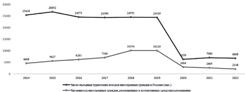
Рисунок 1. Въездной туристский поток (в тысячах поездок) и число иностранных граждан, размещенных в коллективных средствах размещения (в тысячах человек)

Импортозамещение туристских продуктов проявляется в том, что вместо иностранных туристских продуктов, которыми пользовались наши туристы при совершении зарубежных поездок, они стали приобретать туры по России, т.е. замещали зарубежные туры на российские. На рисунке 3 показана динамика