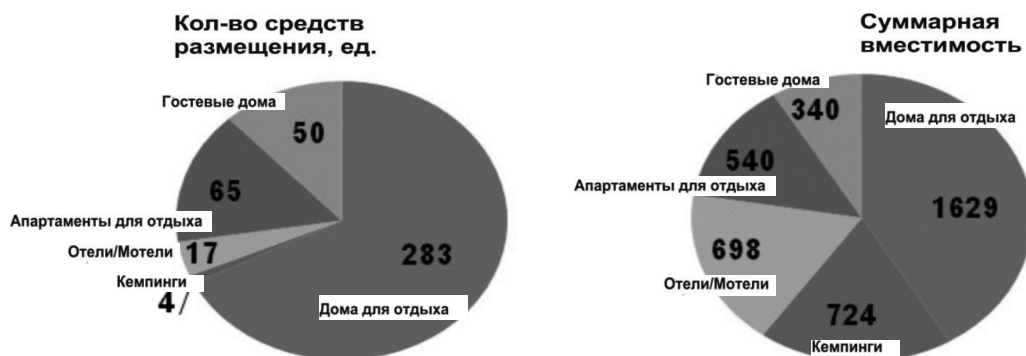
Рис. 1. Количество средств размещения и их суммарная вместимость в графстве Хепберн (штат Виктория, Австралия) в 2008-2009 гг.